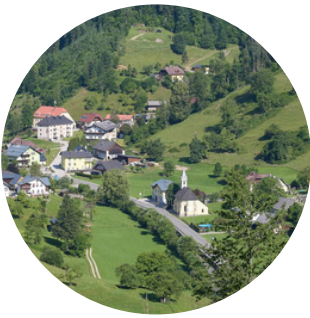
Mein Heimatdorf Unterlaussa

Ich bin in einem kleinen Dorf aufgewachsen. Ohne Bahn, Ohne Bus. Ohne Bim. Wenn man etwas wollte, musste man selbst ins Tun kommen.