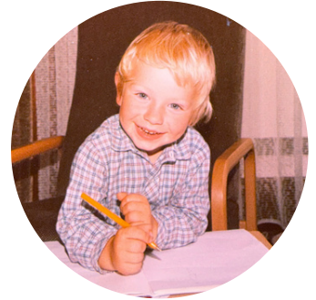
Beim Pläne schmieden.

Danke an meine Eltern, Großeltern und all denen, die davor waren, sowie meinen Mentoren für das, was ihr weiter gegeben habt! Für euer Vertrauen in mich, für das Handwerk aus so vielen Bereichen und das Künstlerische, wie auch den Umgang mit anderen Menschen. Eure Hilfsbereitschaft und den Sinn für das Miteinander trage ich in Ehren weiter!