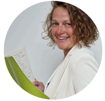
Meine Berufung - Menschen in mental & körperlich in Bewegung bringen

Ein Mentor hat mich eingeladen, den Blick zu verändern. Nicht auf das zu schauen, was ich gelernt oder studiert habe. Sondern auf das, was ich erlebt habe: